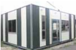
キュービック パラペット仕様