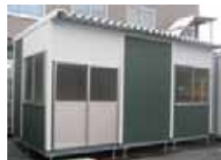
キュービック 片流れ仕様